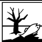
Dangereux pour l'environnement