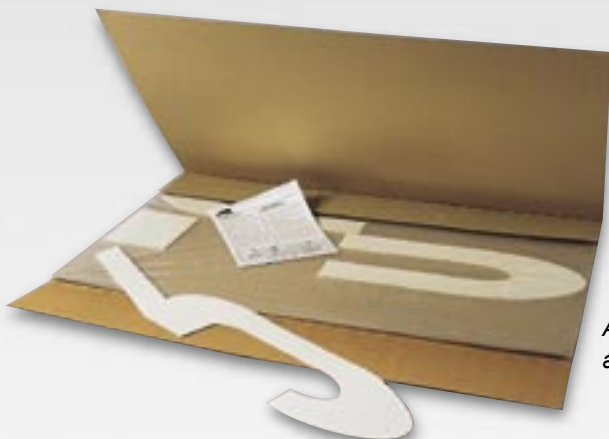
A PREMARK® útburkolati jeleket felvitelre kész állapotban, egyenként csomagoljuk

A PREMARK® egy olyan termoplasztikus anyag, amely a hő hatására összeolvad az úttest felületével, az aszfalttal. Élettartama hat-nyolcszor nagyobb, mint a hagyományos oldószeres festékanyagoké. Hosszabb élettartamának köszönhetően a PREMARK®-ból készült burkolati jelzések különösen alkalmasak olyan nagy forgalommal terhelt útszakaszoknál, mint amilyenek az útkereszteződések, a körforgalmak és a gyalogosátkelőhelyek.