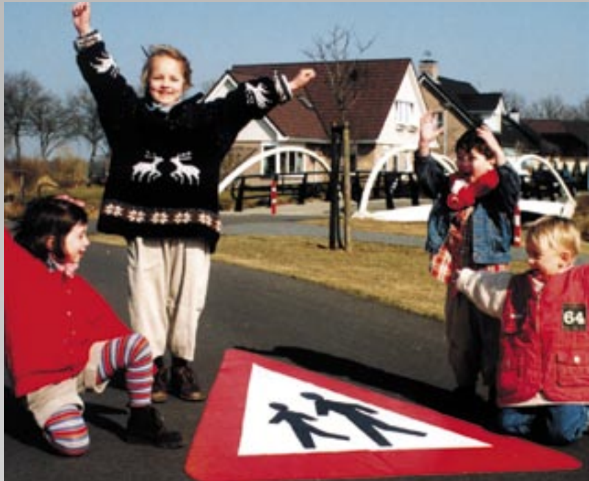
Hyvin suunnitellut ja kestävät tiemerkinnot ovat edellytyksenä liikenneturvallisuudelle.

Mihin vuodenaikaan tahansa PREMARK®-merkinnässä on käytetty ainutlaatuisia tiemerkinnotmateriaaleja, joka ei ole riippuvainen tien lämpötilasta. Sen vuoksi PREMARK® voidaan asentaa mihin vuodenaikaan tahansa. Ainoa vaatimus on, että pohjan, johon PREMARK®-merkinnät asennetaan, on oltava kuiva. Tien pohjan kuivattamiseen voidaan käyttää kaasupoltinta.