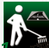
1 Barra la superficie.