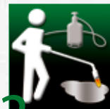
2 Use el quemador de gas (Soplete) para eliminar la humedad.