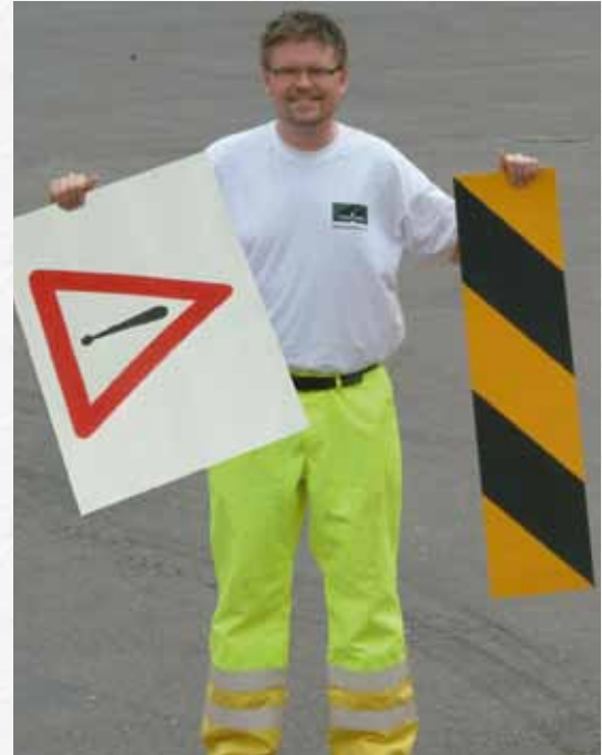
Esto es un Ejemplo de PREMARK® Easy

Así que no dude en elegir PREMARK® siempre que necesite un sistema de marcas viales adecuado, flexible, de gran calidad y de termoplástico prefabricado.