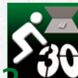
3 Aplique PREMARK®.