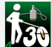
4 Fije el producto PREMARK® con el quemador de gas.