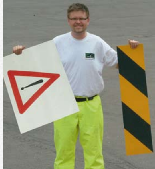
Beispiel von PREMARK® Easy.

Entscheiden Sie sich also für PREMARK®, wenn Sie die richtige, qualitativ hochwertige und flexible Straßenmarkierung aus vorgefertigter Thermoplastik wollen.