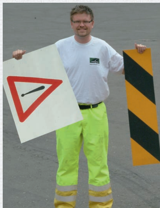
Příklad výrobku PREMARK® Easy

Zvolte PREMARK® kdekoli potřebujete správné, flexibilní, vysoce kvalitní vodorovné dopravní značení, vyrobené z předformovaného termoplastického materiálu.